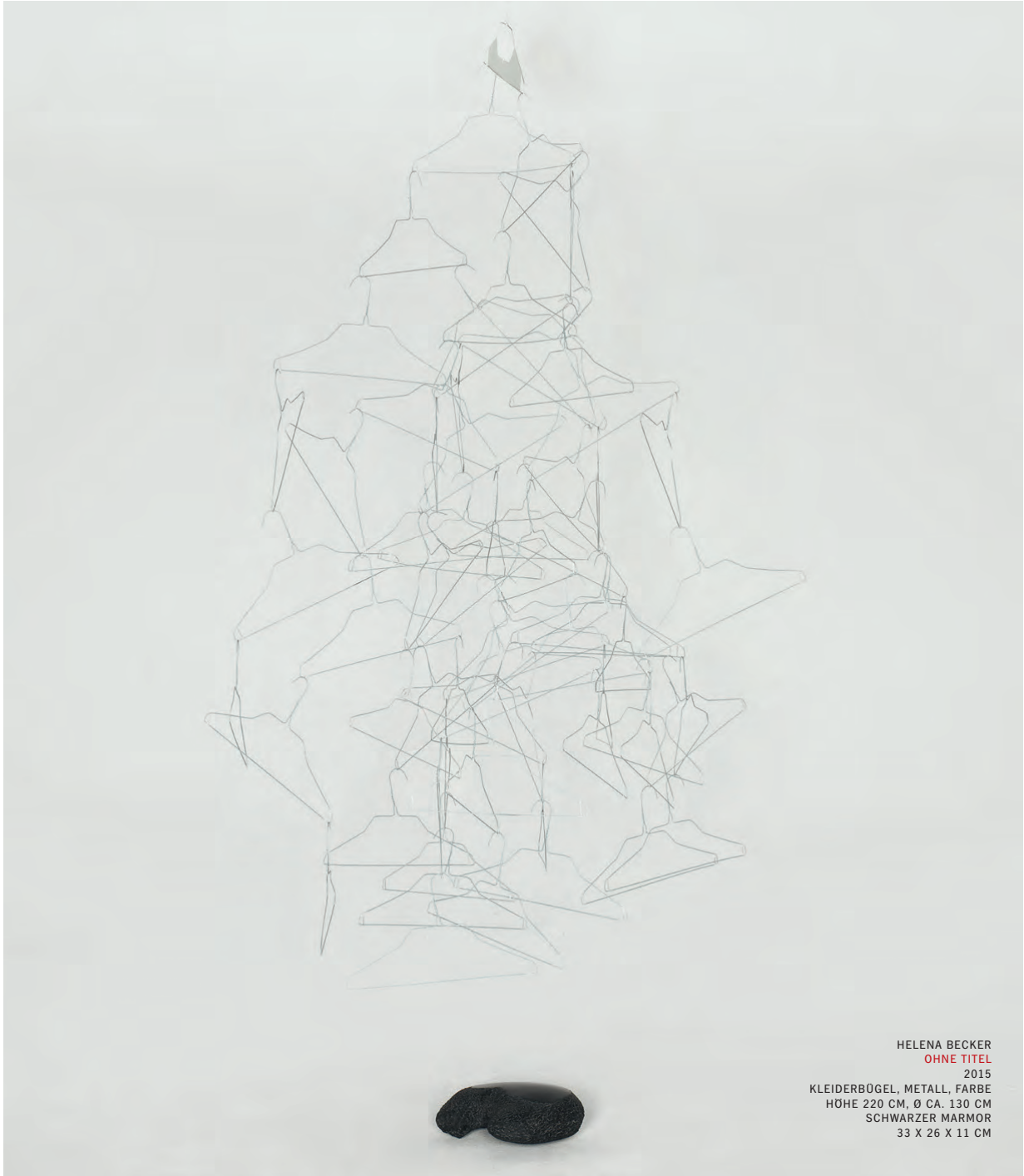
HELENA BECKER OHNE TITEL 2015 KLEIDERBÜGEL, METALL, FARBE HÖHE 220 CM, Ø CA. 130 CM SCHWARZER MARMOR 33 X 26 X 11 CM