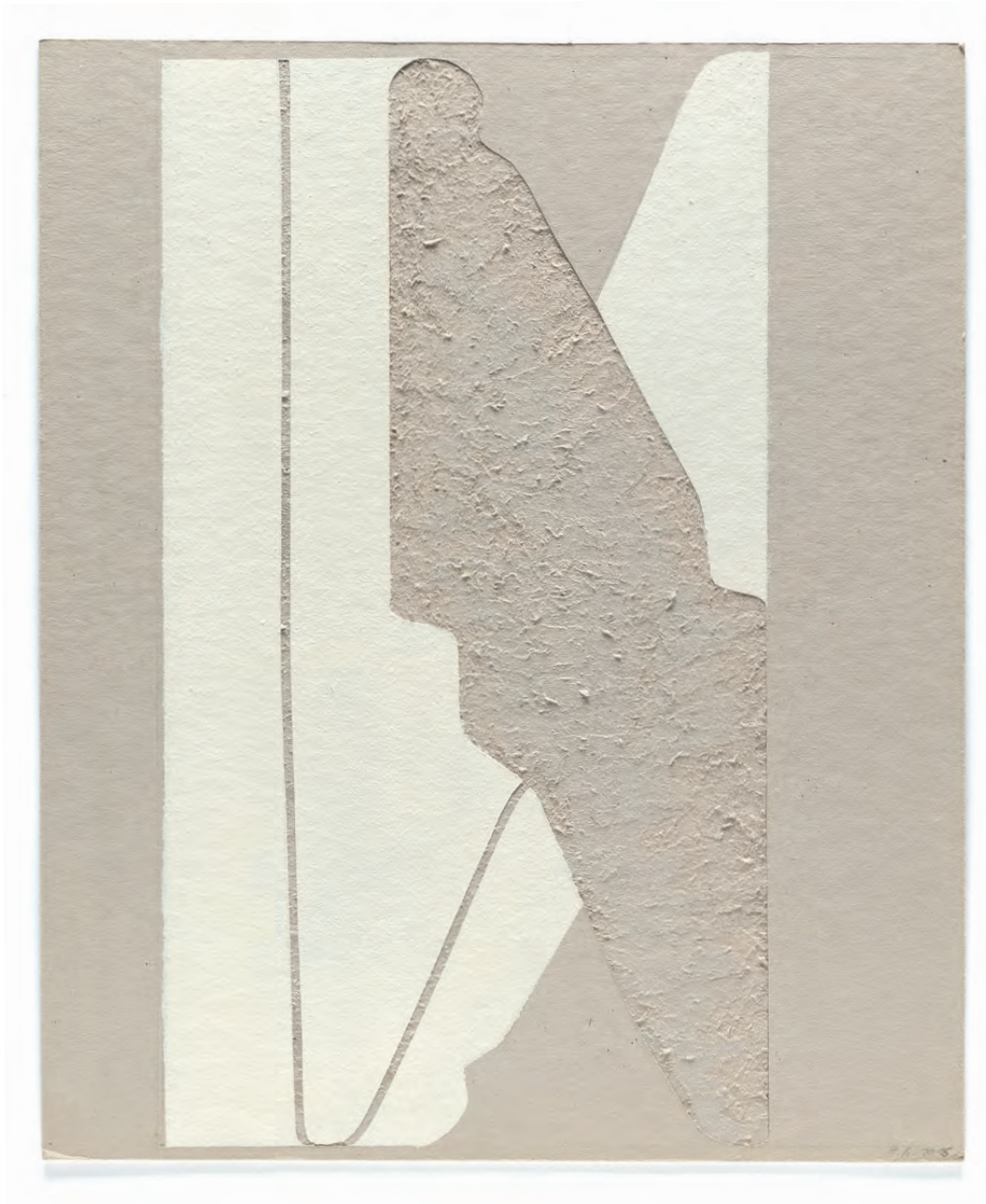
HELENA BECKER OHNE TITEL 2016 KARTON GESCHNITTEN, AUFGERAUT LACKFARBE 32 X 23 CM