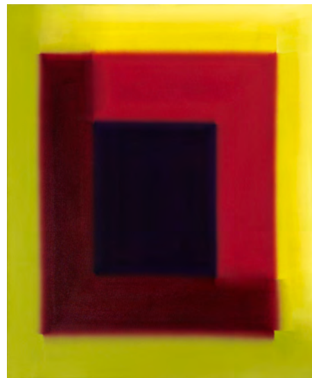
Herzfeld VI 2018 Öl auf Baumwolle 85 x 70 cm